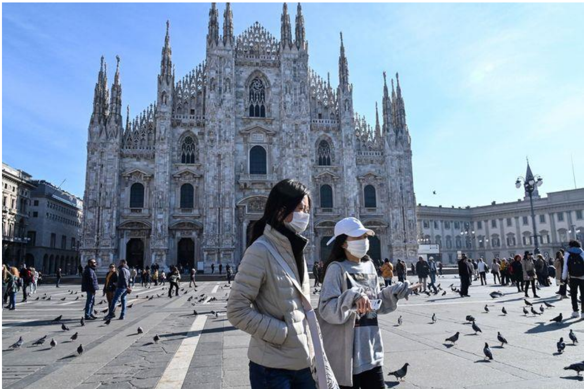
Toeristen op het Piazza del Duomo in Milaan.

Noord-Italië verkeert in de fase die de Chinese stad Wuhan een maand geleden doormaakte. Lukte het nu wel om het virus in te dammen?